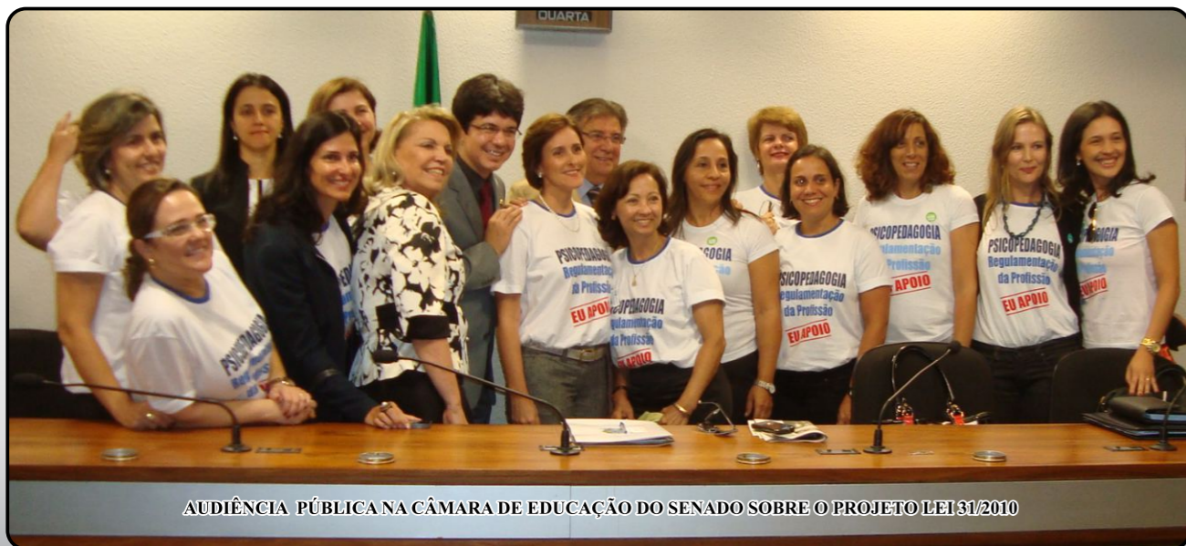
AUDIÊNCIA PÚBLICA NA CÂMARA DE EDUCAÇÃO DO SENADO SOBRE O PROJETO LEI 31/2010